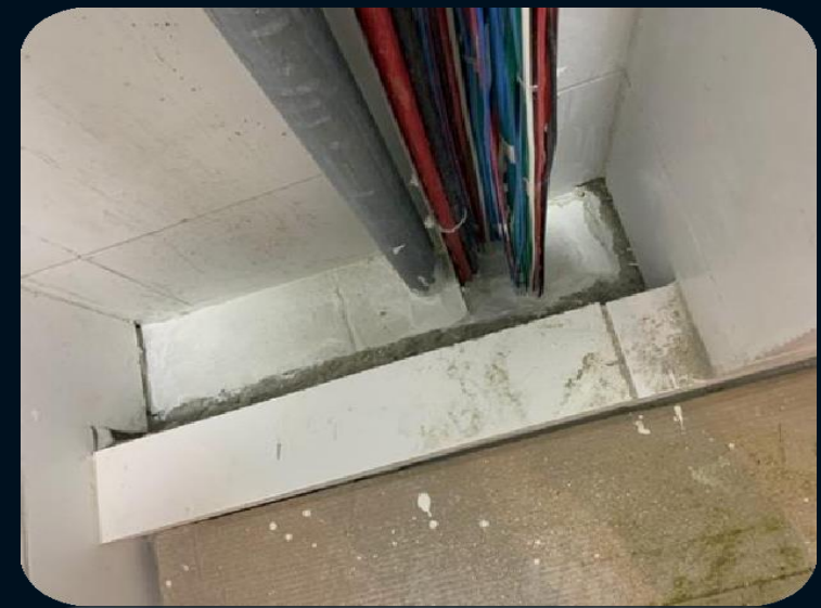
Compartimentação Vertical em Shaft Volp 40 – Tegra